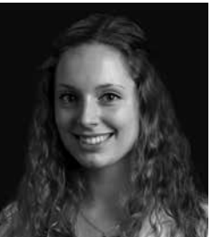
Sylvia Koch Onlineredaktion EVENT PARTNER